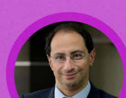
JOSÉ MANUEL RESTREPO Ministro de Comercio, Industria y Turismo